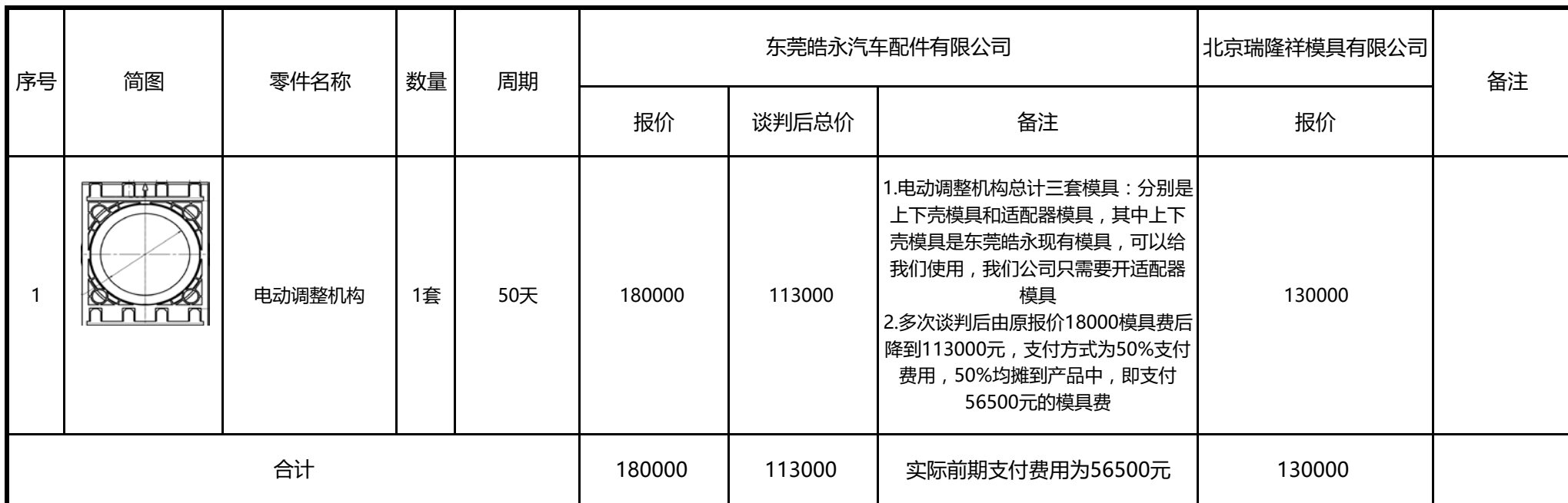
电动调整机构价格对比表