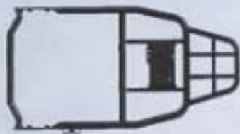
通风正司机背骨架图片

新状态背骨架的价格在通风正司机背骨架价格的基础上加上2.3元; 通风正司机背骨架为未税价: 32.77元; 新状态背骨架的价格为未税价: 35.07元