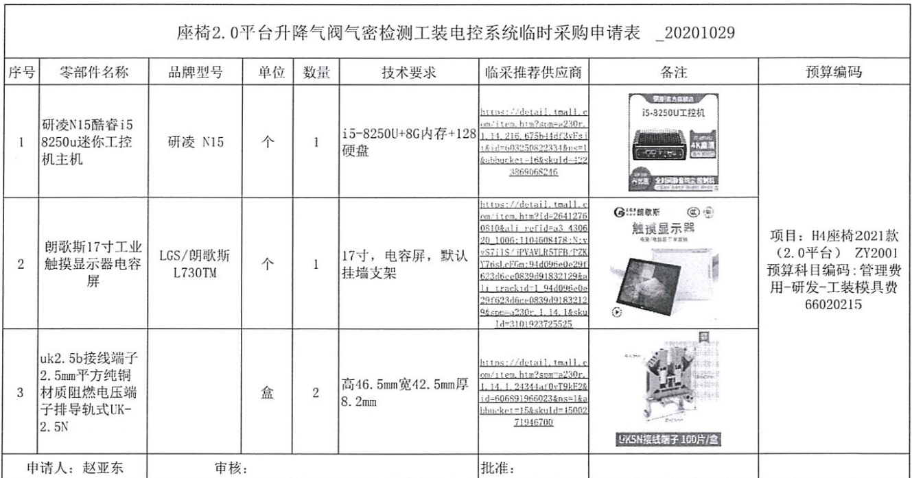
座椅2.0平台升降气阀气密检测工装电控系统临时采购申请表 _20201029