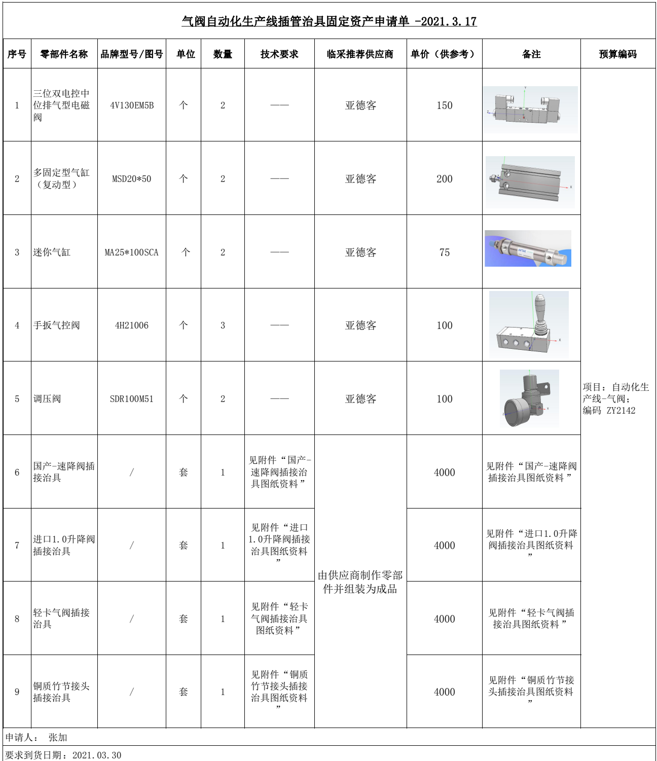
气阀自动化生产线插管治具固定资产申请单 -2021. 3. 17