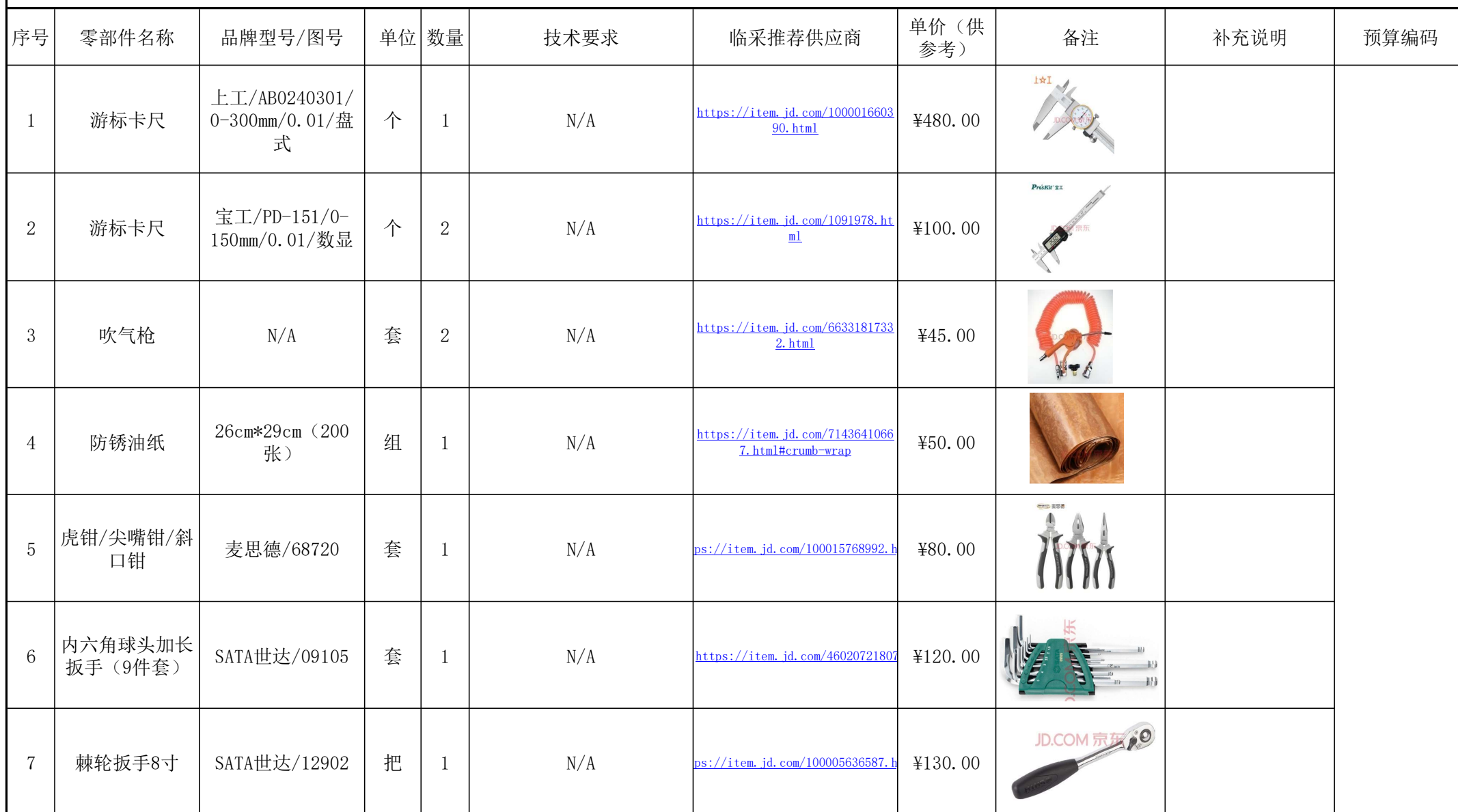
气阀自动生产线、通风加热项目工具采购明细表-20211110