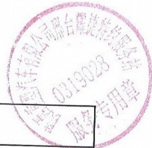
邢台耀捷旧件工时明细表