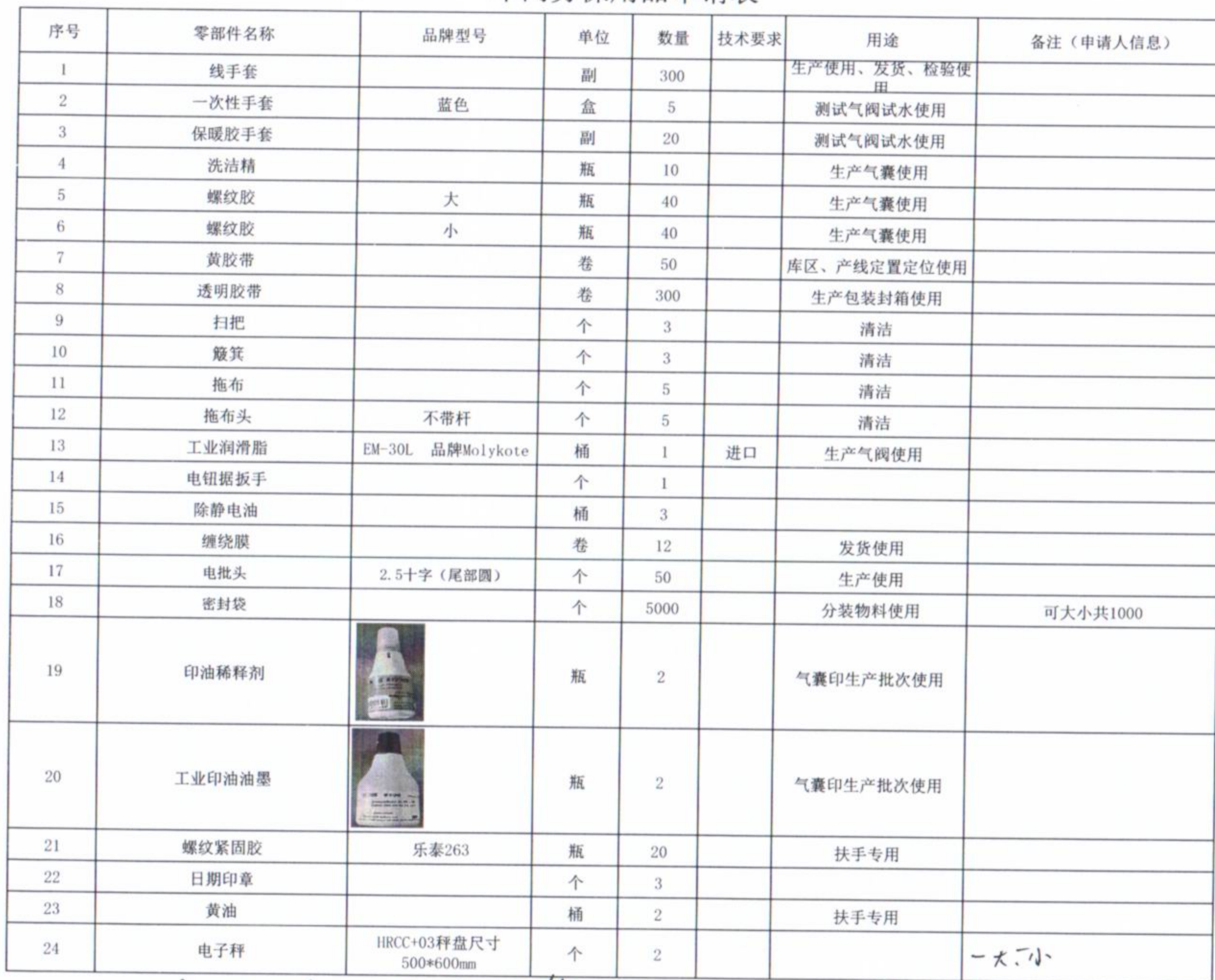
车间劳保用品申请表

附件： 尼龙（PA）专用胶水 PH-8700 1kg/瓶 1 用于管路三通 喷码机墨水 535+ 2