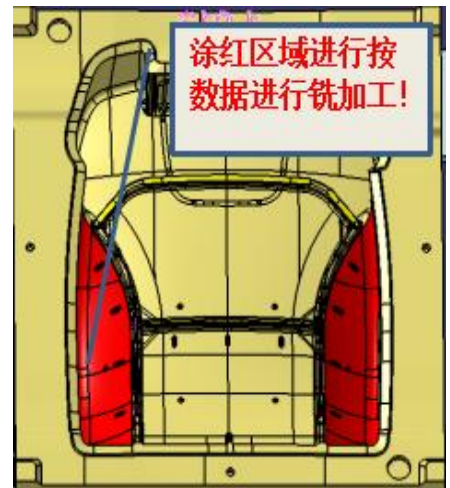
产品加厚区域示意