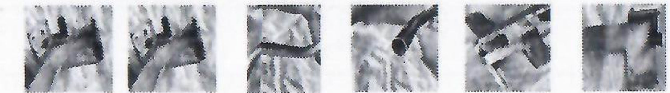
图一 图二 图三 图四 图五 图六