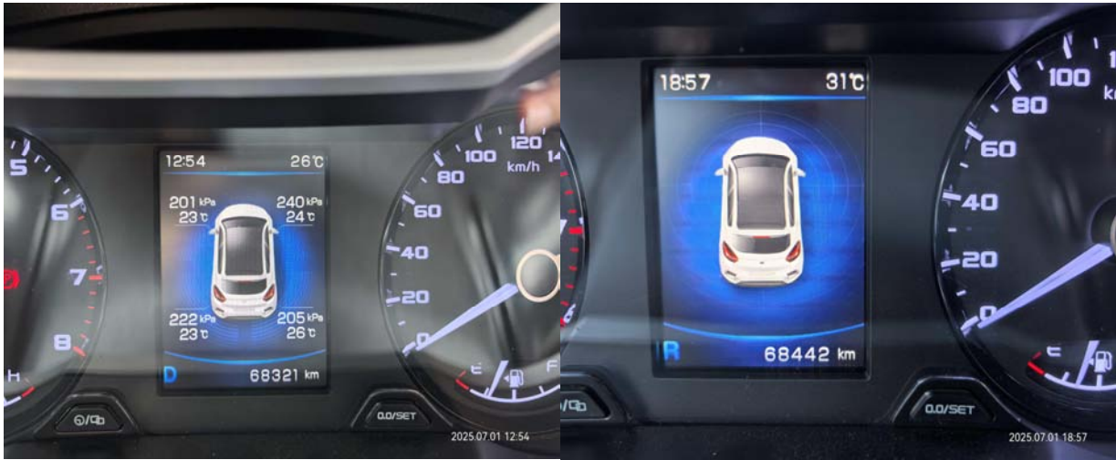
起始里程68321km, 返回里程68442km, 共计121km。