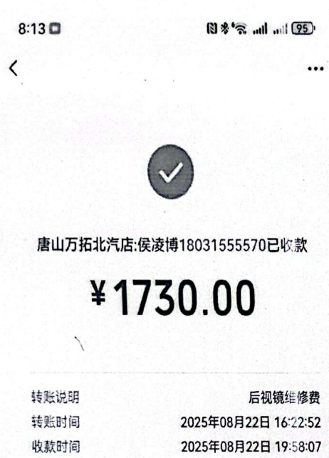
唐山万拓付款记录