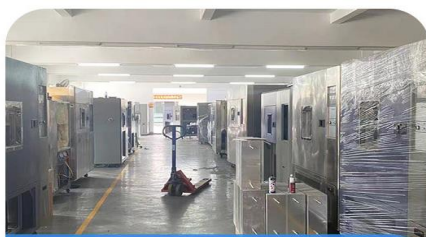
冷热冲击箱生产车间