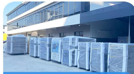
试验设备批量出货