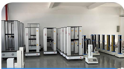
拉力试验机大量库存