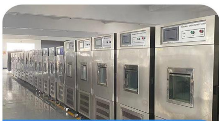
恒温恒湿箱生产车间

FACTORY DISPLAY . STRENGTH CERTIFICATION