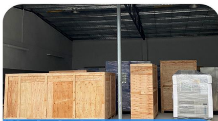
木架/木箱包装出库