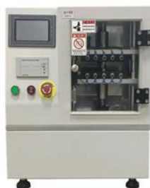
密封圈耐久试验设备示意