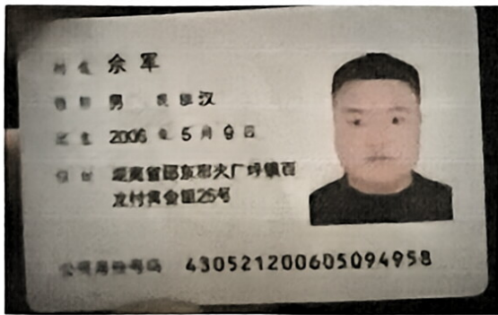
证人身份证复印件粘贴处（正面）