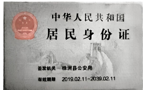
身份证复印件粘贴处（反面）